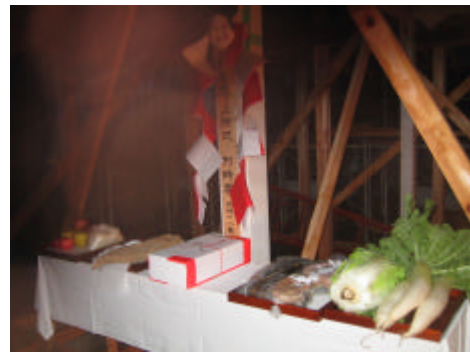
お供え物 お米と野菜は我が家の産物です