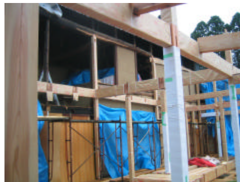
古い家と新しい家の合体部分