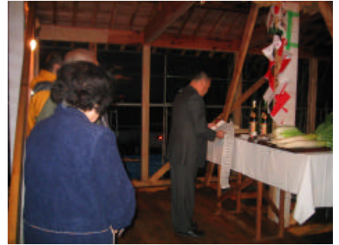
北岡社長が祝詞をあげている様子