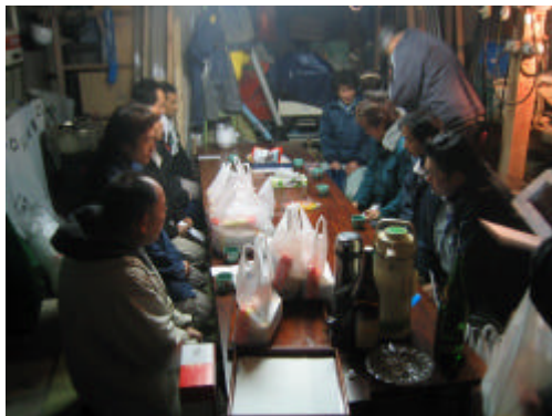
←上棟式終了後 大工一同 ホット一息の瞬間 施主の父より感謝の気持ちを一人一人に手渡す