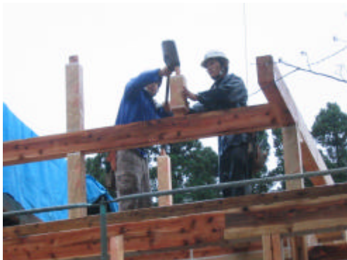
掛け矢の音とかけ声が響きます

従業員の大工が、一生懸命刻んでくれた木が運び込まれました。少し小雨が降っていたので、私たちはケガのないように祈りながら眺めていました。父（長男 66歳）伯母（長女 81歳 次女 71歳）たちは、我が家の屋敷林（防風林）と一緒に育ったので、亡き祖父のことや、小さい頃、屋敷林に水をあげていた思い出話をしながら、この木を生かしてくれた (有)北岡工務店 に感謝していました。