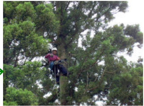
きこりの 枝打ち →