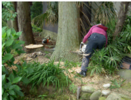
← きこりの 木の伐採