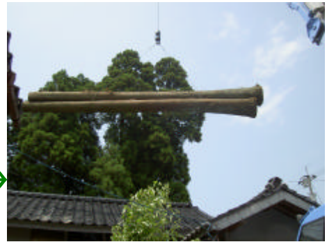
レッカーにて → 木の引き上げ